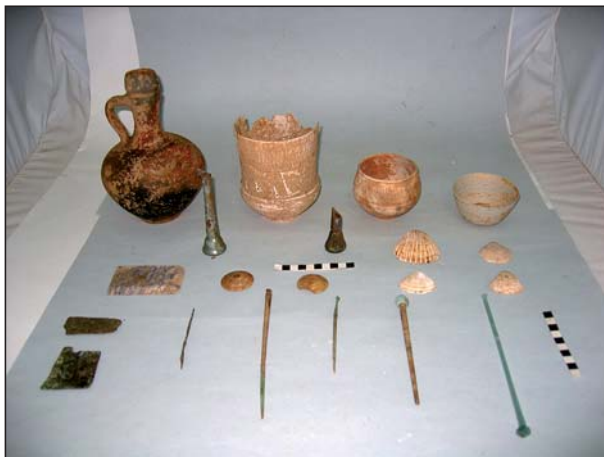
FIGURA 21 Depósito funerario de la A 41.

un objeto fusiforme o huso de 16 cm de longitud (8137/146/12) en cuya cabeza se encuentra montada una pieza en piedra de forma circular, decorada con líneas incisas paralelas en espiral, un agitador de vidrio verde, decorado en espiral de 21 cm de longi-