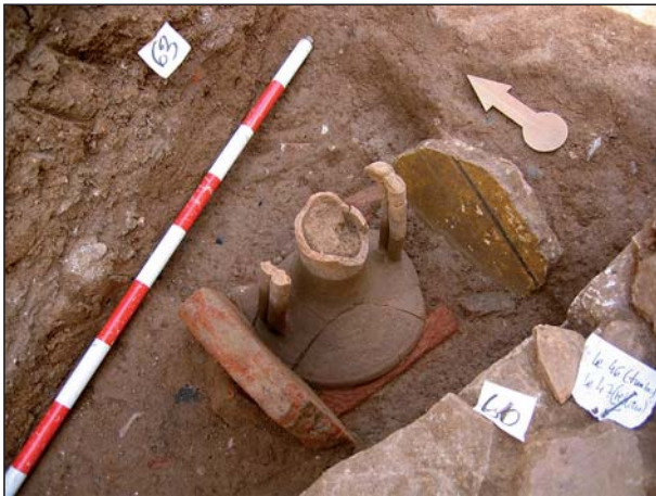
FIGURA 5 Tumba de incineración, A16.

dimensiones de 1 m x 60 cm, orientada N – S. No se aprecia depósito funerario.