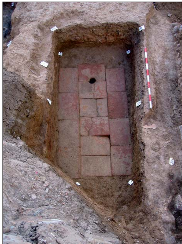
FIGURA 15 Cubierta de la tumba de la A 21.

siones de 1.90 x 1.20 m, en la que se observa un tubo de libaciones formado por dos ímbrices adosados.