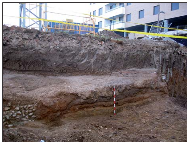
FIGURA 10 Sección estratigráfica en el camino.