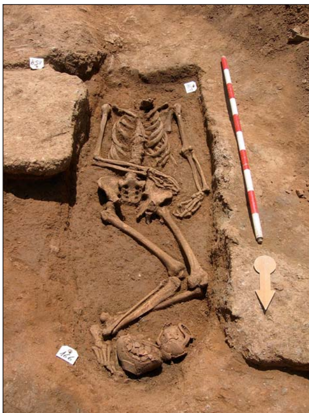
FIGURA 23 Inhumación A23.

un objeto fusiforme o huso de 16 cm de longitud (8137/146/12) en cuya cabeza se encuentra montada una pieza en piedra de forma circular, decorada con líneas incisas paralelas en espiral, un agitador de vidrio verde, decorado en espiral de 21 cm de longi-