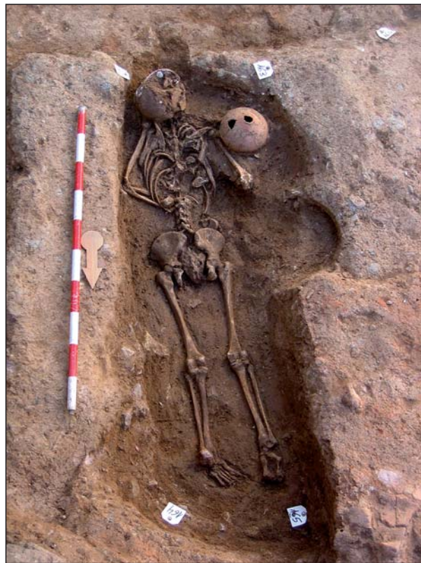
FIGURA 22 Inhumación A 22.

tud, forma Isings 79 (8137/146/13) y extremos con cabeza circular.