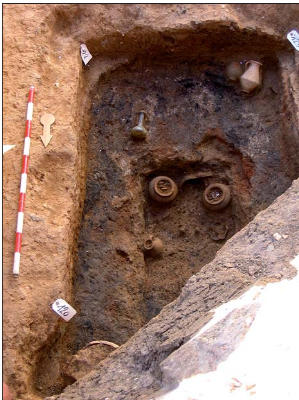
FIGURA 13 Incineración A20 y depósito funerario.

un jarro similar a la forma 7e de Smith Nolen (8137/80/3) y un tarrito piriforme con borde exvasado y pie cilíndrico, forma III de Sánchez (8137/80/4). Se adscribe este depósito a la 2ª mitad del s. I e inicios del s. II d. C (fig. 12 y 13).