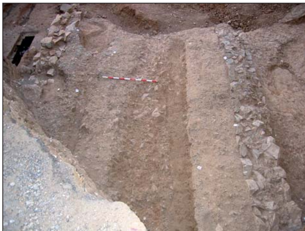
FIGURA 7 Superficie de rodadura, ue135.