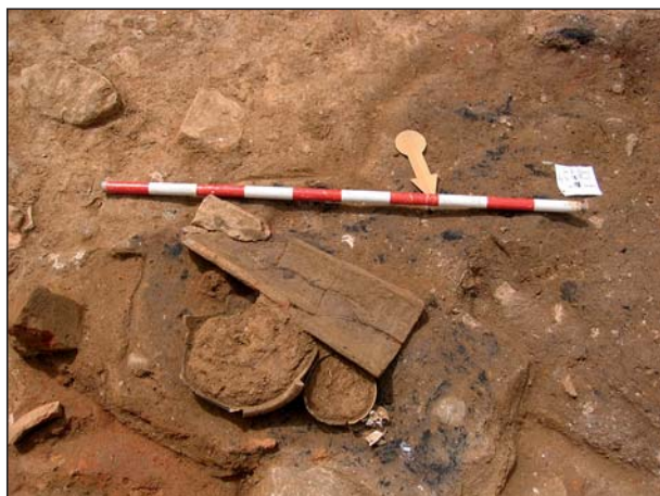
FIGURA 2 Incineración, A10.