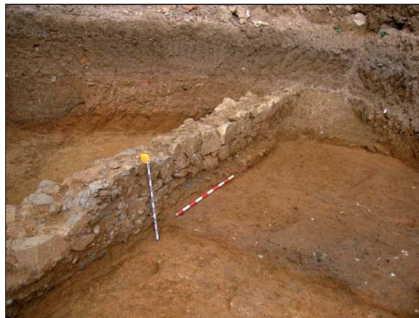
FIGURA 8 Paramento de los muros ue136 y ue20.

utilizar cal para trabar los mampuestos, bien careados, sobre una cimentación a base de guijarros de cuarcita (fig. 8 y 9).