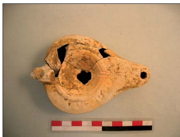
FIGURA 4 Lucerna 8137/37/1.

La incineración A 14 se realiza en fosa simple de forma ovalada, con un diámetro aproximado de 1.00 m, delimitada en superficie por algunos fragmentos de tamaño menudo de material latericio y mampuestos de diorita del mismo tamaño. En el relleno se documentaron tres recipientes cerámicos muy deteriorados, pendientes de su recomposición y de un estudio más exhaustivo.