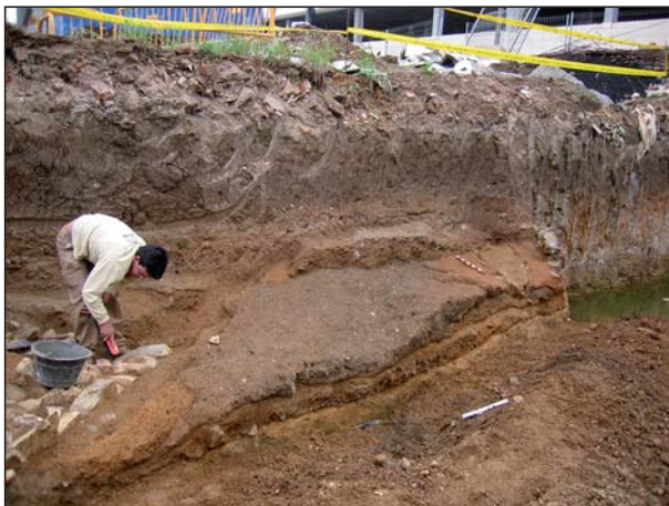
FIGURA 11 Sección estratigráfica en el camino.

bastante elevado, correspondiente a la forma I de Sánchez (8137/78/2), con decoración "carretilha" y un jarro correspondiente con la forma 7e de Smith Nolen (8137/78/3). Se completa el depósito con dos ollas (8137/80/1 y 8137/80/2), forma II de Sánchez,