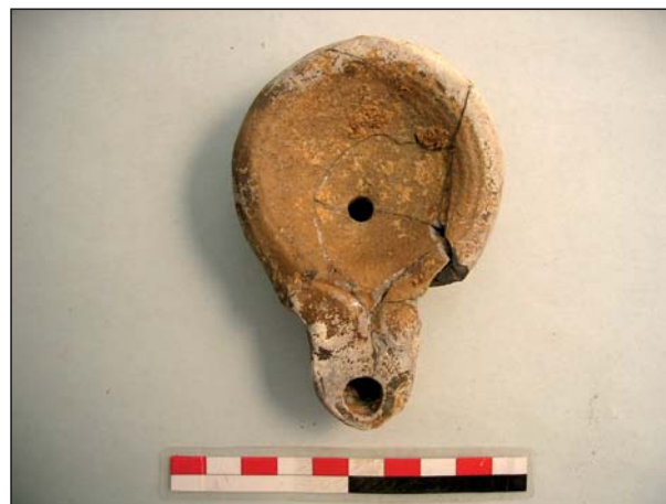
FIGURA 3 Lucerna 8137/36/2.

pera, forma Deneauve VI A, adscrita entre finales del siglo I y II d.C (fig. 3 y 4). Se completa este depósito con un cuenco de cerámica común, forma 2b, grupo A de Smith Nolen, una olla de cerámica común y una moneda de bronce ilegible.