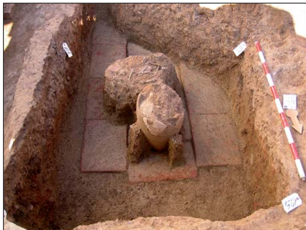
FIGURA 14 Tubo de libaciones de la A 21.

una dimensiones de 2.00 x 1.30 m, orientada E – W. En su relleno interior se localiza un espacio (1.10 x 0.30 m), delimitado por fragmentos de ladrillos, donde se registra su depósito funerario compuesto por un recipiente de vidrio, forma 88 de Isings (8137/143/1), un vasito de “cáscara de huevo” (8137/143/2), forma XXXIV de Mayet y un cuenco de paredes finas decorado con lúnulas (8137/143/3), XLIV de Mayet, fechados en época de Claudio – Nerón (fig. 18).