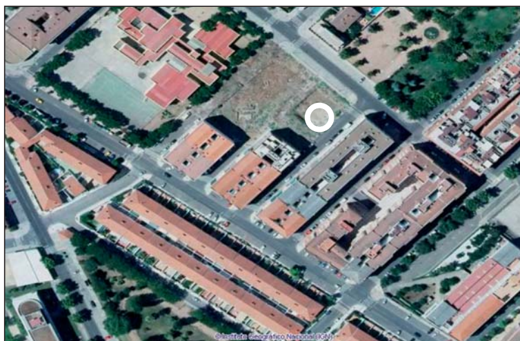
SITUACIÓN DEL SOLAR