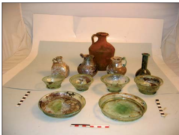
FIGURA 16 Depósito funerario de la A 21.

En la medianera sur del solar encontramos una incineración de doble fosa [A38], observada de forma parcial en el perfil, con forma rectangular y ángulos redondeados, orientada SW – NE, con unas dimen-