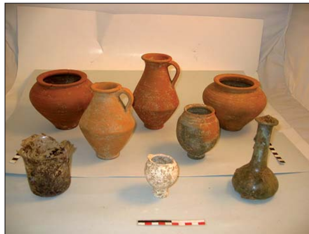
FIGURA 12 Depósito funerario de la A20.

bastante elevado, correspondiente a la forma I de Sánchez (8137/78/2), con decoración "carretilha" y un jarro correspondiente con la forma 7e de Smith Nolen (8137/78/3). Se completa el depósito con dos ollas (8137/80/1 y 8137/80/2), forma II de Sánchez,