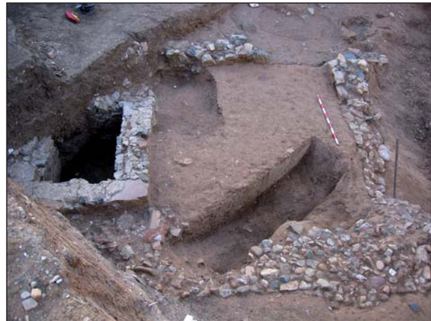
FIGURA 6 Estructuras de A11 y A 12.

El recinto funerario [A 12] presenta una forma cuadrangular con unas dimensiones parciales de 4.20 x 3.10 m., orientado SW – NE, con una compartimentación interna donde se localiza una tumba monumentalizada [A 11] de forma rectangular, situada en el centro, con unas dimensiones de 2.25 x 1.60 m. En su fábrica emplea opus incertum , a base de mampuestos de diorita trabados con cal, con muy buen careado. El ancho de los muros varía entre los 25 cm. y los 28 cm. Su relleno interior, formado por tierra arcillosa de grano fino y textura compacta, presenta un registro cerámico muy rodado, adscrito a época altoimperial, junto algún fragmento de már-