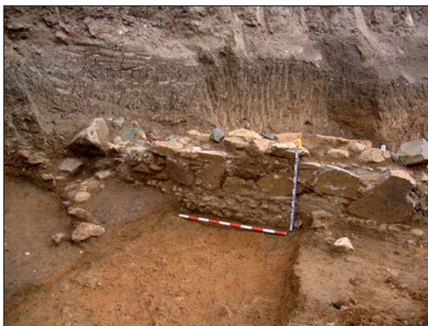
FIGURA 9 Paramento de los muros ue136 y ue20.

Bajo ue 29 documentamos un grupo de incineraciones realizadas en fosa doble de forma rectangular, orientadas SE - NW y SW - NE, con tubo de libaciones, localizadas en la medianera W y S. El primero de estos enterramientos documentados [A 20] presenta rito incinerador, con unas dimensiones de 2.00 x 1.10 m, orientada N - S, en cuyo interior se documenta otra fosa de menores dimensiones (0.90 x 0.50 m). El tubo de libaciones se sitúa en la esquina NE de la fosa mayor, formado por un fragmento de ánfora. El depósito funerario se encuentra distribuido por ambas fosas y se compone de un ungüentario de vidrio, Isings 28 (8137/78/1), un vasito ovoide con hombros más o menos marcados, cuello troncocónico y estrecho, borde cóncavo y base con pie cilíndrico